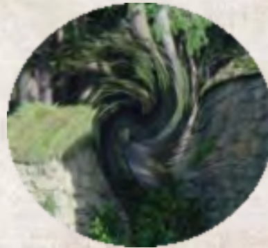
Hättet ihr's gewusst? Nicht alle Champions konnten erraten, was sich hinter diesem Bilderrätsel verbirgt.

die Hand, womöglich, um sich selbst anzufeuern. Eigentlich war Miss Pliveas Taktik jedoch eine andere – sie versuchte nämlich angestrengt, vor der Runde noch ein wenig Latein zu lernen. Ist dies etwa eine Geheimstrategie, die ihr den entscheidenden Vorteil bringen soll? Währenddessen verteilte Champion Alexandra Twain aus Slytherin Schokolade und Cathlyn Dream aus Gryffindor beruhigte sich mit ein wenig klassischer Musik. Alles interessante Taktiken, die jedoch jäh ein Ende finden mussten, als Professor Blackbird die Regeln der Aufgabe verkündete. Jedem Champion wurde im Folgenden ein Jurymitglied zugewiesen (wobei natürlich dringlichst darauf geachtet wurde, keine Hauslehrer mit ihren Schützlingen zusammenzubringen). Miss Twain wurde Professor Rig zugeteilt, Miss Huven kam unter die Fittiche von Prof. McWilliams, Miss